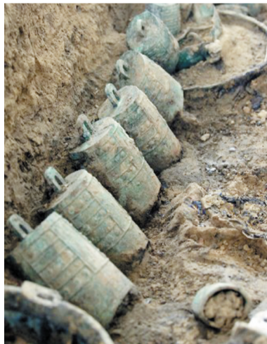
双墩一号墓出土文物